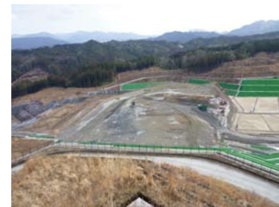
2014年2月28日現在 クリーンセンター滋賀埋立状況