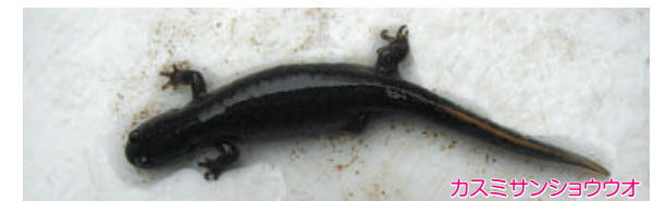
カスミサンショウウオ